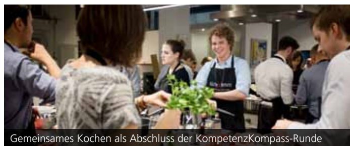
Gemeinsames Kochen als Abschluss der KompetenzKompass-Runde

Welches Potenzial steckt in mir und wie aktiviere ich es? Was erwartet ein Arbeitgeber von mir? Wie wachsen wir als Team zusammen? Antworten auf diese und weitere Fragen erarbeiten Studierende im KompetenzKompass, einem Programm des KIT zur Persönlichkeits- und Karriereentwicklung, das in enger Kooperation mit Unternehmen aus der Region in eine neue Runde startet. Als neuer hochkarätiger Partner neben der SEW-EURODRIVE GmbH & Co KG konnte das in Pforzheim ansässige Unternehmen WITZENMANN GmbH gewonnen werden. Aus vielen exzellenten Bewerbungen wurden insgesamt 20 Teilnehmerinnen und Teilnehmer ausgewählt, die sich im Laufe der kommenden zwei Jahre sowohl in Seminaren zu Internationalem Projektmanagement, Interkulturellen Kompetenzen, Innovationsmanagement, Selbstführung oder ethischem wirtschaftlichem