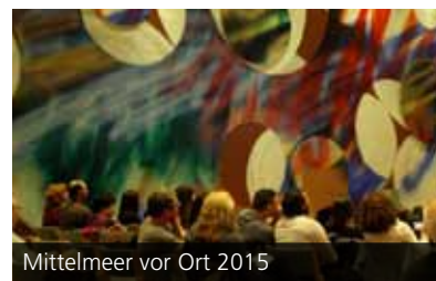
Mittelmeer vor Ort 2015

ruhe e.V. ausgewählte Kurzfilme junger israelischer Regisseurinnen und Regisseure gezeigt wurden. Die jungen Filmemacher sind Teil einer neuen israelischen Generation, ihre Kurzfilme greifen die Vielschichtigkeit der israelischen Gesellschaft