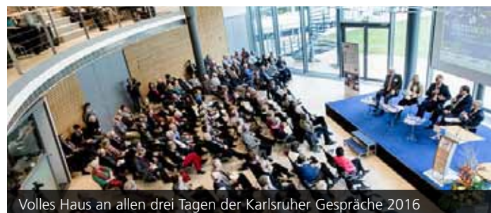
Volles Haus an allen drei Tagen der Karlsruher Gespräche 2016