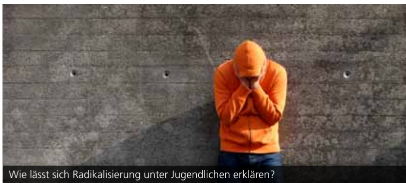
Wie lässt sich Radikalisierung unter Jugendlichen erklären?

Im Internationalen Forum analysiert Lamya Kaddor unter dem Titel „Salafismus. Warum Jugendliche aus Deutschland in den Dschihad ziehen“ die Hintergründe für die Attraktivität der fundamentalistischen Islamform und die Rekrutierungsmethoden der Salafisten. Zudem zeigt sie auf, wie die Gesellschaft präventiv tätig werden kann, um die junge Generation vor dem Islamismus zu schützen. Der Vortrag findet am Montag, 25. April 2016 um 18 Uhr im NTI-Hörsaal, KIT Campus Süd in Kooperation mit dem Internationalen Begegnungszentrum (ibz) Karlsruhe e.V. statt. Weitere Informationen unter: www.zak.kit.edu/internationales_forum .