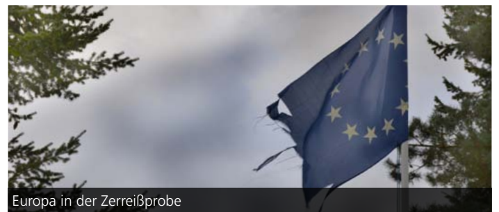
Europa in der Zerreißprobe

Der Ausgang des Brexit-Votums im Juni 2016 war für die meisten europäisch interessierten Bürger sehr überraschend. Die große Mehrheit der Öffentlichkeit hatte trotz der knappen Umfragewerte nicht mit einem Erfolg des Ausstiegswillens der Briten gerechnet. Der Brexit kann als Weckruf an die europäischen Eliten verstanden werden, die eine so virulente Renationalisierung einzelner Länder bis zuletzt nicht für möglich hielten. Eine immer stärker globalisierte Welt bedeutete für sie die zwangsläufige Relativierung nationaler Gestaltung. Inzwischen aber gibt es seit mehreren Jahren in fast allen europäischen Ländern Formen neuer nationalistischer Bestrebungen, die bis in die Mitte der Gesellschaft dringen. Der Beginn eines