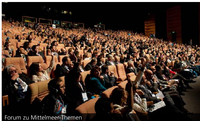
Forum zu Mittelmeer-Themen