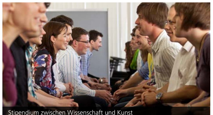
Stipendium zwischen Wissenschaft und Kunst

Zeitgenössische Kunst ist oft ein Indikator für gesellschaftliche Entwicklungen, für deren Werte und Wandel. Für angehende Leistungsträger in Forschung und Wissenschaft und für zukünftige Führungskräfte sind Verantwortungsbereitschaft und ein geschultes gesellschaftlich-kulturelles Verständnis unabdingbar. Unter dem Leitgedanken „Kulturelle Kompetenz für künftige Führungskräfte“ bietet der Kulturkreis der deutschen Wirtschaft mit seinem Arbeitskreis Kulturelle Bildung (AKB) in Kooperation mit dem KIT deshalb ab 2017 zehn ausgesuchten Studierenden die Chance, im Rahmen des Bronnbacher Stipendiums ein Jahr lang in Dialog mit renommierten Persönlichkeiten aus der Kunst- und Kulturszene zu treten und deren Arbeitsweisen kennenzulernen. In bis zu zehn Abend- und Wochenendveranstaltungen erhalten die Stipendiatinnen und Stipendiaten im Rahmen von Workshops, Vorträgen und Exkursionen einen Überblick über aktuelle Kunstproduktionen und kunstwissenschaftliche Ansätze. Dabei treffen sie auf Kunstschaffende, auf Persönlichkeiten aus Kunstvermittlung und Kulturmanagement und lernen durch den direkten Austausch, eigenständig neue Denkansätze zu entwickeln und kreative Lösungswege zu beschreiten. Weitere Informationen zu Programm und Bewerbung finden Sie unter: www.zak.kit.edu/bronnbacher_stipendium .