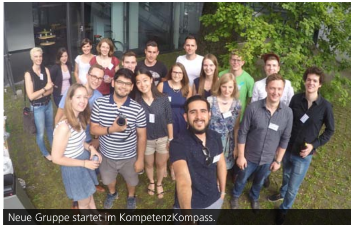
Neue Gruppe startet im KompetenzKompass.

Die Academy findet in enger Verzahnung mit Akteuren am KIT statt, die sich bereits mit der Nachhaltigkeitsthematik beschäftigen. Teilnehmerinnen und Teilnehmer können für ihre aktive Mitarbeit im Projektseminar sechs Leistungspunkte erwerben. Weitere Informationen unter: www.zak.kit.edu/studium_generale_und_lehre .