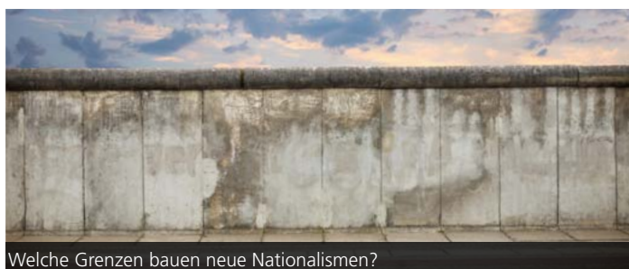
Welche Grenzen bauen neue Nationalismen?

politischen Umdenkens zeichnet sich ab, dessen Ausmaß bislang nicht abzusehen ist. Im Wintersemester 2016/17 wendet sich das ZAK im Colloquium Fundamentale daher den in den letzten Jahren verstärkt aufkommenden Renationalisierungstendenzen in Europa zu. Welche Ursachen haben trotz der weltweiten Internationalisierung zu einer Rückkehr nationalistischer Tendenzen geführt? Seit wann agieren rechtspopulistische Bewegungen in Europa? Welche Gemeinsamkeiten und Unterschiede besitzen sie und welchen Stand haben sie bereits in der Akzeptanz der Gesellschaft erreicht? Welche Rolle kommt den Medien, insbesondere den sozialen Medien, in der Erstarkung der nationalistischen Bewegungen zu? Das Colloquium eröffnet Prof. Dr. Julia Angster, Inhaberin des Lehrstuhls für Neuere und Neueste Geschichte an der Universität Mannheim am Donnerstag, 20. Oktober 2016 um 18 Uhr im Redtenbacher-Hörsaal (Geb. 10.91, KIT Campus Süd). Die Reihe schließt mit Prof. Dr. Helmut Willke zum Thema „Herausforderungen der Demokratie in Zeiten der Konfusion“ am Donnerstag, 26. Januar 2017. Nähere Informationen und alle Termine können Sie unserer Homepage www.zak.kit.edu/colloquium_fundamentale entnehmen.