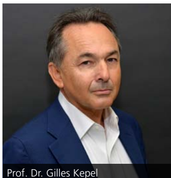
Prof. Dr. Gilles Kepel

Die Stiftung Centre Culturel Franco-Allemand veranstaltet in Kooperation mit dem ZAK einen Vortrag auf Französisch. Es spricht der renommierte Politologe Prof. Dr. Gilles Kepel.