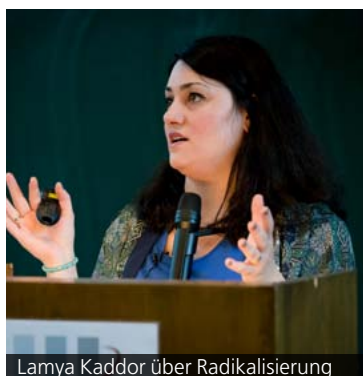
Lamya Kaddor über Radikalisierung

In einer Kooperationsveranstaltung mit dem Internationalen Begegnungszentrum Karlsruhe (ibz) wurde im Sommersemester 2016 das Thema Salafismus vorgestellt.