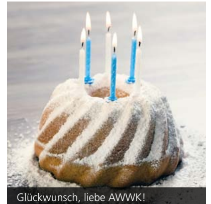
Glückwunsch, liebe AWWK!

Spektrum an wissenschaftlichen Disziplinen interessierten Bürgerinnen und Bürgern frei von Zulassungsqualifikationen nähergebracht hat. Im neuen Programm für das Wintersemester 2016/17 werden über 40 Seminare, Vorlesungen und Vorträge unterschiedlichster Fachrichtungen sowohl natur- als auch geisteswissenschaftlicher Disziplinen angeboten. Alle Kurse sind einzeln belegbar und setzen in der Regel kein größeres Vorwissen voraus. Die Angebote und Informationen zur Anmeldung finden Sie unter: www.awwk-karlsruhe.de . Das Programm liegt zudem in zahlreichen öffentlichen Einrichtungen Karlsruhes aus. Der Jubiläumsabend mit Vorträgen, Slams und Musik findet am Mittwoch, 23. November 2016, 19 Uhr im Medientheater des ZKM | Zentrum für Kunst und Medien statt. Der Eintritt ist frei.