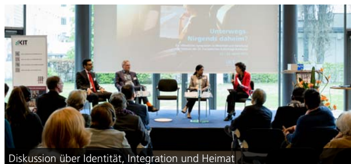
Diskussion über Identität, Integration und Heimat