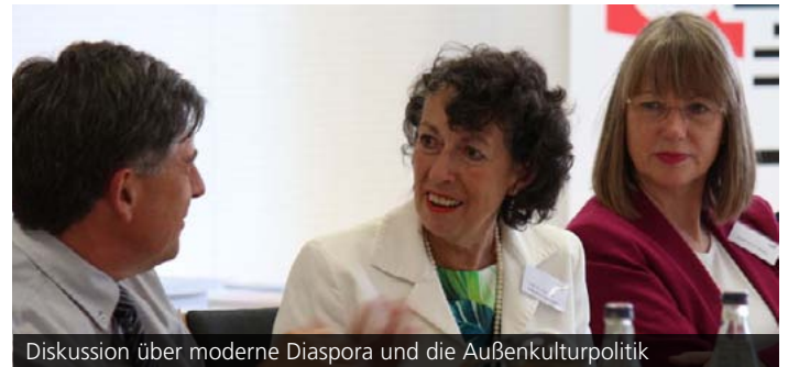
Diskussion über moderne Diaspora und die Außenkulturpolitik