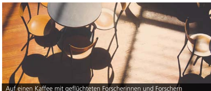
Auf einen Kaffee mit geflüchteten Forscherinnen und Forschern

Das ZAK wird im kommenden Wintersemester 2016/17 in Kooperation mit dem International Scholars & Welcome Office (ISCO) des KIT ein neues Veranstaltungsformat ausrichten, in dem Geflüchtete über ihre wissenschaftliche Arbeit berichten. Im Anschluss an eine Kurzdarstellung findet, ganz im Sinne des titelgebenden Cafés, ein Gespräch statt, in dem gemeinsam mit einem landeskundigen Gesprächspartner die akademische Lage im Herkunftsland des Referierenden erörtert wird. Wie sieht der Forschungsalltag in Syrien, Usbekistan oder in der Türkei aus? Was bedeutet ein freies akademisches Klima für die Forschung? Und welche Implikationen hat es für eine Gesellschaft, wenn ihre Wissenschaftlerinnen und Wissenschaftler nicht mehr im eigenen Land forschen können? Das neue Format ist Teil des KIT-Angebots im Rahmen der Philipp Schwartz-Initiative,