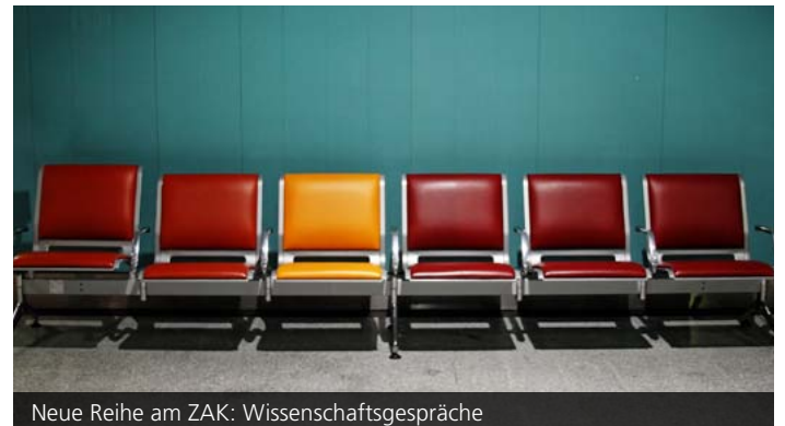
Neue Reihe am ZAK: Wissenschaftsgespräche

Die Vision vom geteilten Wissen des Internets hat Forschung und Lehre, aber auch die Wirtschaft verändert. Das Open-Content-Prinzip sorgt dafür, dass Expertenwissen und praktisches Wissen ebenso verfügbar sind wie künstlerische Inhalte – mit einschneidenden Folgen etwa für Verlage, Musik- und Unterhaltungsindustrie. Gleichzeitig gelingt es neuen Start-ups mithilfe von frei zugänglicher Soft- und Hardware neue Märkte zu erschließen. In der Wissenschaft hat sich die Forderung nach Open Access, also dem freien Zugang zu Forschungsdaten immer mehr durchgesetzt. Dabei soll auch die Forschung selbst im Sinne einer Open Science verbessert werden. Gleichzeitig steht diese Entwicklung in der Kritik, Urheberrechte und Forschungsfreiheit zu gefährden. Könnte das Open-Access-Prinzip auch