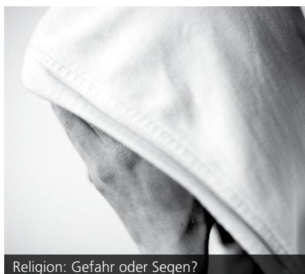
Religion: Gefahr oder Segen?

Der Interreligiöse Campusdialog greift im Wintersemester 2016/17 die aktuelle Diskussion um das Gefahrenpotenzial von religiös motiviertem Fanatismus auf, in der zum Teil auch die Tragweite der staatlichen Toleranz kritisiert wird. In einem aufgeheizten gesellschaftlichen Klima mit oftmals unsachlicher und polarisierender medialer Berichterstattung möchte die Projektgruppe in differenzierter Form die Frage nach dem Beitrag der Religionen zu sozialer Stabilität untersuchen. Zudem werden die Tendenzen zur Radikalisierung sowie zur steigenden Intoleranz sowohl von christlichen wie muslimischen Gruppen gegenüber „Nicht-Gläubigen“ diskutiert. In einem Podiumsgespräch unter anderem mit dem Religionssoziologen Prof. Dr. Wolfgang Eßbach und dem Koordinator des türkischen Moscheeverbands Ditib, Murat Kayman, soll erörtert werden, ob auch in säkularen Staaten wie Deutschland die nach wie vor große gesellschaftliche Relevanz von Religion wünschenswert ist. Oder ob Positionen eines aufgeklärten Humanismus, Atheismus sowie freigeistiger Einstellungen mehr zu einem guten Klima des gesellschaftlichen Miteinanders beitragen. Die Veranstaltung findet am Montag, 5. Dezember 2016 um 18.30 Uhr im Hertz-Hörsaal (Geb. 10.11, KIT Campus Süd) statt. Weitere Informationen finden sich unter: www.zak.kit.edu/interreligioeser_dialog .