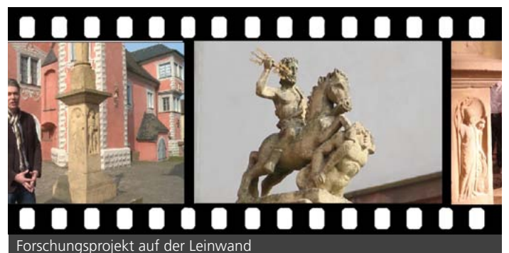
Forschungsprojekt auf der Leinwand

Wie arbeiten Wissenschaftlerinnen und Wissenschaftler aus unterschiedlichen Disziplinen miteinander? Was hat es mit der römischen Sandsteinsäule in Ladenburg auf sich, die zu Beginn des 1. Jahrtausends zerbrach, aufgebaut, verschüttet, ausgegraben, wieder verschüttet und dann in den 1970ern fast vollständig zerstört wurde? Der Dokumentarfilm „Krieg der Titanen – Rätsel um die Jupitergigantensäule“ widmet sich diesen Fragen und zeigt auf, wie Karlsruher und Heidelberger Wissenschaftlerinnen und Wissenschaftler verschiedenster Disziplinen miteinander auf die spannende Suche nach Antworten gehen. Als Partner des kooperativen Forschungsprojekts ‚Multidimensionale Sicht- und Erfahrbarmachung von Kulturerbe (MUSIEKE)‘ im Rahmen der ‚Heidelberg Karlsruhe Research Partnership (HEiKA)‘ produzierte das ZAK diesen Dokumentarfilm. Im Film berichten die direkt am Projekt beteiligten Forscher über die archäologischen Hintergründe, die Digitalisierungstechnologien und die neuen Möglichkeiten, die Öffentlichkeit an den Forschungsergebnissen teilhaben zu lassen. Film und weitere Informationen unter: www.zak.kit.edu/heika_musieke .