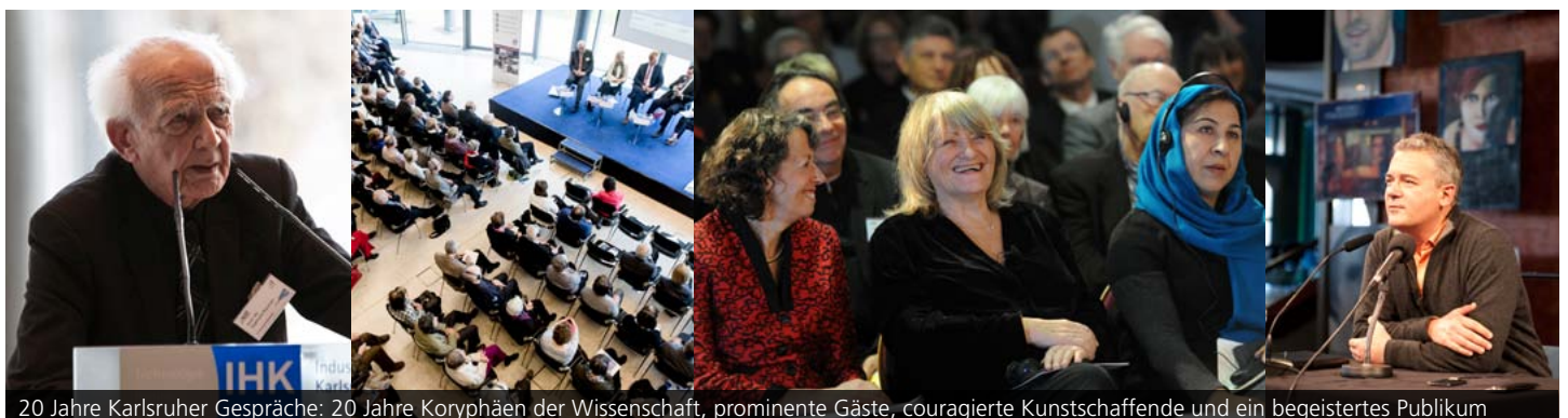
20 Jahre Karlsruher Gespräche: 20 Jahre Koryphäen der Wissenschaft, prominente Gäste, couragierte Kunstschaffende und ein begeistertes Publikum

Der Erfolg der Karlsruher Gespräche wurde durch die Besucherbefragung 2016 eindrucksvoll bestätigt: Fast 90 Prozent der Besucherinnen und Besucher bewerteten die inhaltliche und konzeptionelle Gestaltung mit gut oder sehr gut. Die Mehrheit fühlte sich sehr gut informiert und gab an, die Veranstaltung als Perspektivenerweiterung wahrgenommen zu haben. Die Evaluation können Sie nachlesen unter: www.zak.kit.edu/karlsruher_gespraech .