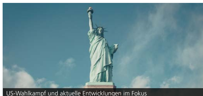
US-Wahlkampf und aktuelle Entwicklungen im Fokus