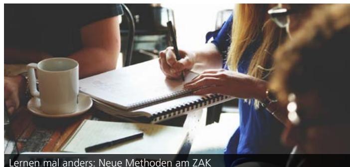
Lernen mal anders: Neue Methoden am ZAK

Im Rahmen des Begleitstudiums „Nachhaltige Entwicklung“ bekommen Studierende die Gelegenheit, am Blended-Learning-Seminar