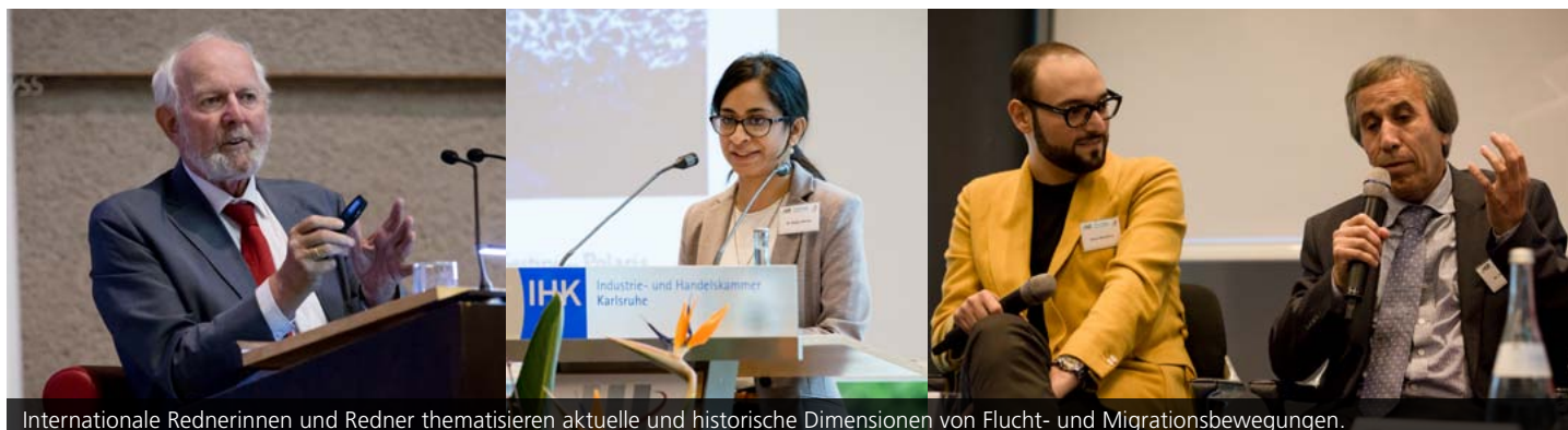
Internationale Rednerinnen und Redner thematisieren aktuelle und historische Dimensionen von Flucht- und Migrationsbewegungen.